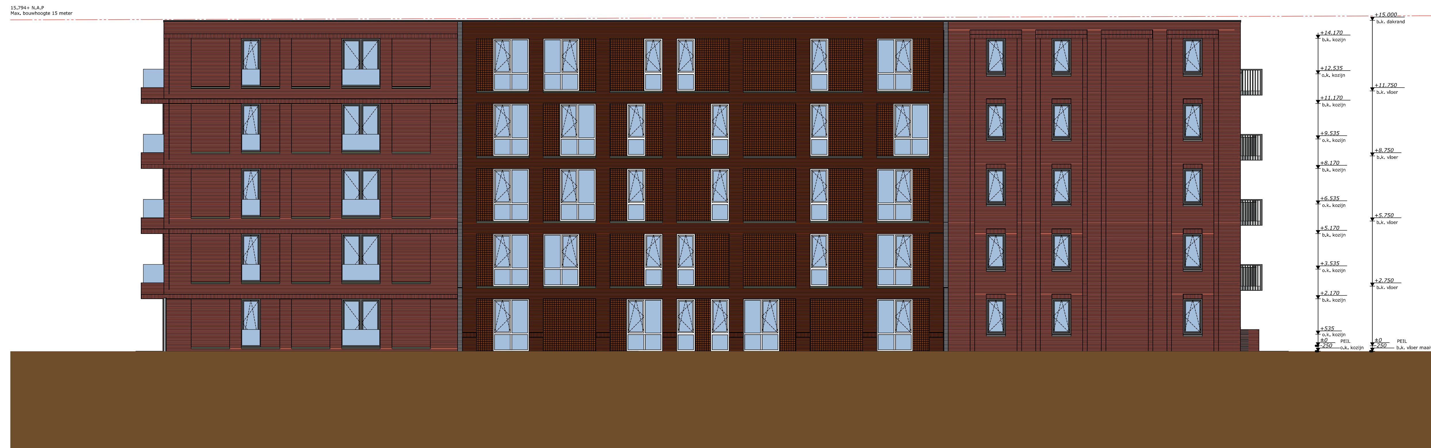
Rechtergevel Wijzigingen Algemeen Totale gebouw 1622 mm verlaagd